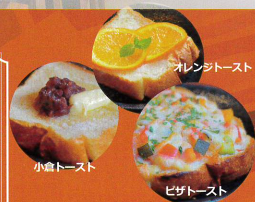
オレンジトースト