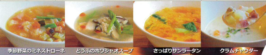
季節野菜のミネストローネ